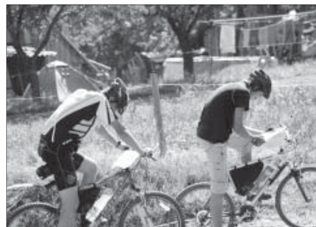
Cyklistika je dřina.