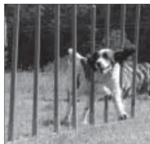
Rychlost tu hrála hlavní roli.