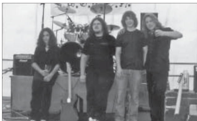
Členové kapely Spoken.