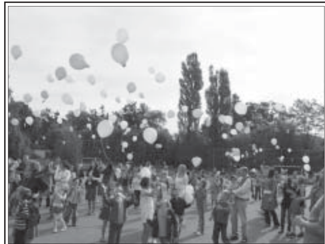
Hromadný start balonků v Sedmikrásce.

Už mě nafukují. Jsem docela pěkný, velký balonek, mám červenou barvu. Někdo si mě vzal, je to holčička a dává na mě cedulku se jménem Tereška Koniřová a adresou školy, do které chodí. Chytila mě za provázek a vyšla ven. Moc lidí tam ještě nebylo, ještě nevím, co se bude dít. Vidím, že děti přibývá a všichni někam jdeme. Došli jsme na školní hřiště. Hodně dětí tu běhá s jinými balonky a holčička, co mě drží, si povídá s kamarádkou. A už se počítá: deset, devět, osm, sedm ..... tři, dva, jedna, teď! A holčička mě pouští a kouká se na mě. Letím výš a výš, snad dohoním své kamarády, co uletěli dřív než já. Je to krásné, tolik barevných teček na nebi! Doufám, že