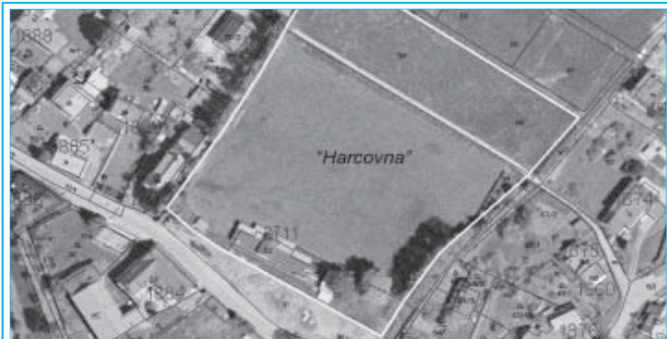
Areál Harcovny napodruhé našel svého majitele.

Zástupce společnosti FAGUS 21 Svatopluk Carbol však tak vstřícný k textu smlouvy nebyl. „Předpokládám, že o finálním znění smlouvy se ještě bude jednat,“ řekl. Nelíbily se mu především sankce, které kupujícímu hrozily v případě nedodržení