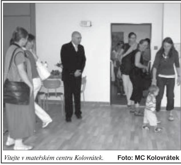
Vítejte v mateřském centru Kolovrátek.