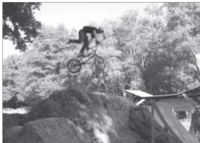
Tomu se říká odvaha.

prezentace a poté bikeri pilně trénovali na hlavní závod. Závodilo se ve dvou kategoriích – freestyle BMX a MTB. Pro vysvětlení – freestyle BMX se jezdí na malých dvacetipalcových kolech, svým duchem má tato disciplína asi nejbližší skateboardingu, ve kterém jde o akci, adrenalin, styl a v neposlední řadě o pohodu a partu kamarádů. Leckdo si BMX plete s bikosem, což zdaleka není stejné. Kromě toho, že se bikros jezdí také na malých dvacetipalcových kolech, nemá s freestylem téměř nic společného. Ve freestyle BMX jde o to předvést na jednotlivých překážkách co nejvíce triků.