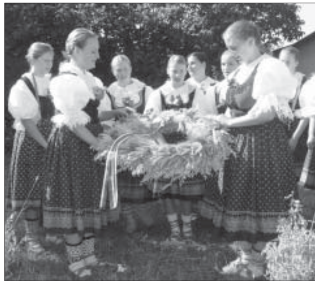
Obilný dožínkový věnec.

odměnil hospodář žence a žničky dobrým vínem a hospodyně napekla chutné vdolečky. Poté