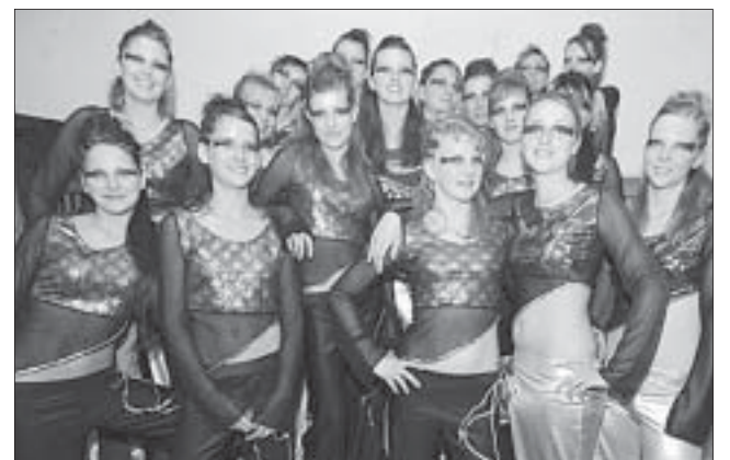
Taneční skupina Mimo.

Také proto letos přípravu na soutěž nepodcenily a trénovaly už od ledna, těsně před soutěží pak až šestkrát týdně. Soutěžní tým se skládal z devatenácti nejlepších tanečnic jak ze Zašové, kde byla