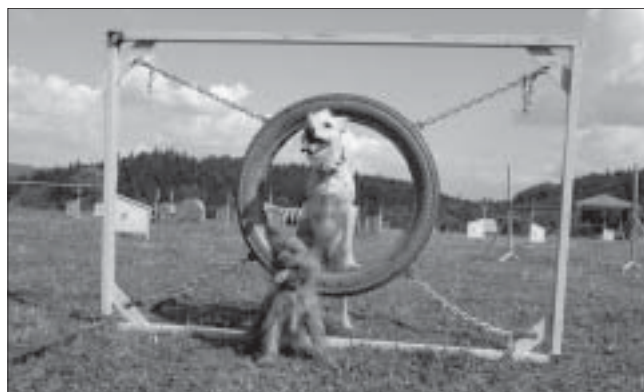
Některé překážky si pejsci oblíbili.