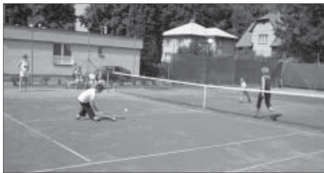
Kluci v akci.

Hned po obědě se proti sobě utkali žáci prvního stupně, kteří