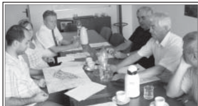
Historicky první jednání o zřízení Muzea Tesly.

Muzeum Tesly, jak se o tomto tématu hovořilo na prvním setkání pracovní skupiny 24. srpna 2008 na městském úřadě, by v prvé řadě mělo mít spíš skromnější podobu.