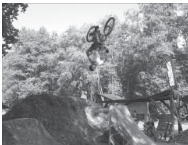
Krásně provedený backflip.

Podrobnosti najdete na: www.sweb.cz/lyžaři