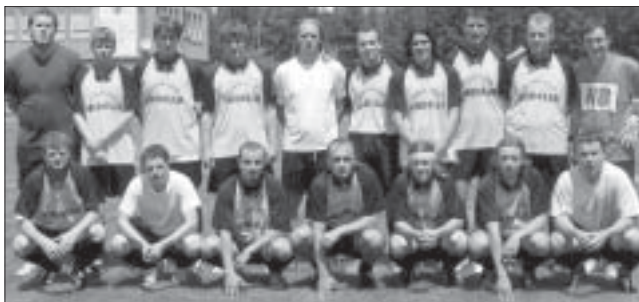
TJ Sokol Horní Bečva.