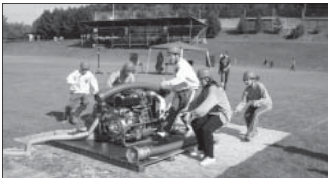
Mladí hasiči při požárním útoku.

V sobotu 6. 9. se uskutečnila ve Vigantcích ve sportovním areálu TJ Vigantice soutěž hasičů o pohár okrsku č. 3 v kategorii mladších a starších žáků. Tato soutěž je zahrnuta do okresní ligy MH. Pro úspěšné zvládnutí soutěže museli hasiči absolvovat dvě disciplíny - štafetu dvojic a požární útok dle hry Plamen. Cílem této hry je rozvíjet dětské znalosti, vědomosti a dovednosti a získávat návyky v oblastech požární ochrany. Vyhlašovatelem hry Plamen v České republice je SH ČMS. Soutěže se v kategorii starších žáků zúčastnila družstva Vigantice, Bystřička, Hutisko-Solanec, Huslenky, Liptál, Oznice a Zubří. V mladších žácích Oznice, Liptál a Hutisko-Solanec. „Družstev nepřijelo mnoho, a to z