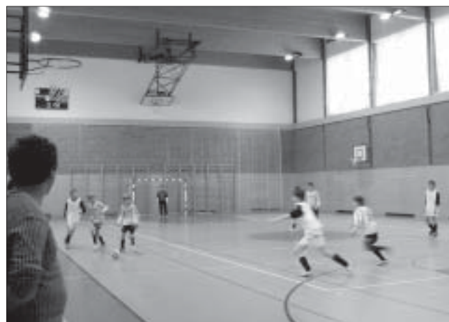
Mladí hráči v akci.