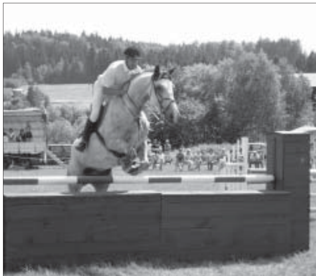
Přeskok přes hrazdu.

Děkujeme všem ekipám i divákům za účast na našich závodech a všem sponzorům, spolupracovníkům a členům JK Valaško za spolupráci při přípravě této akce. Poděkování patří také obci Prostřední Bečva a jejím občanům za tolerantní přístup. I. Dulavová