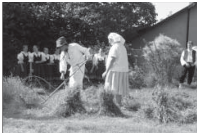
Poslední sečení obilí.

Již po sedmé se v neděli 31. 8. 2008 uskutečnila ve Valašské Bystrici Dožínková slavnost v režii valašského souboru Troják. Vše začalo v místním kostele děkovnou bohoslužbou za úrodu. Po mši se lidé a krojovani