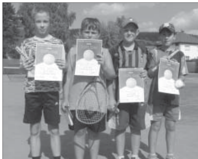
Vítězové druhé kategorie.