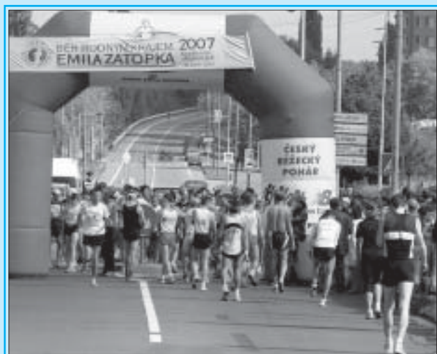
Také letos závod odstartuje Dana Zátopková.

Závod je zařazen do seriálu Českého běžeckého poháru 2008. Bližší informace naleznete na oficiálních stránkách závodu http://beh-roznov.koprivnice.org/ . -lum-