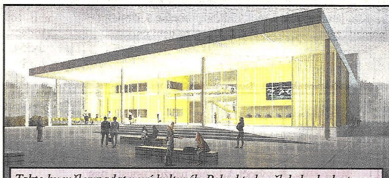
Takto by měl vypadat nový kulturák. Pokud tedy někdy bude dostaven.

Odstoupení od smlouvy znamená, že se výstavba kulturního centra nyní pozastavuje. Variant na to, jak bude nakonec celý problém vyřešen, je nyní několik. Do uzávěrky týdeníku Jalovec však město s žádným oficiálním stanoviskem nepřišlo. Jednou z avizovaných variant je, že radnice přistoupí na požadavek navýšení ceny a dodavatelská společnost se vrátí do práce. Tento předpoklad je však málo pravděpodobný. Vládnoucí uskupení by si totiž pár týdnů po volbách naprosto protřečilo. Další variantou tedy je, že bude vyhlášeno nové výběrové řízení na zhotovitele. Tato forma řešení nastalé situace ale nekorresponduje především časově. Jak již bylo zmíněno, pokud nebude centrum hotové do daného termínu, město nedosáhne na 120 milionů korun vysokou dotaci na pasivní standard. Ve hře tak samozřejmě zůstává i úplné ukončení projektu. Chytřejší v tomto ohledu budeme po zasedání zastupitelstva města, které proběhne v úterý 8. listopadu. (mar)